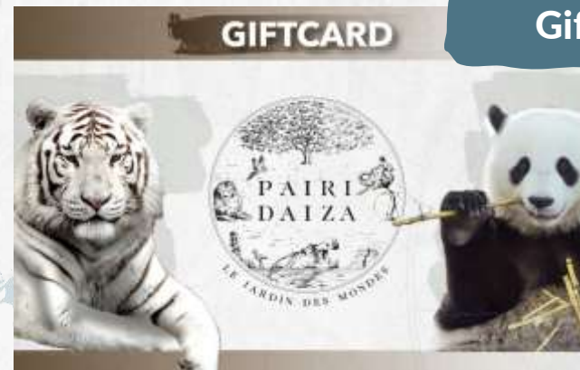
Giftcard Pairi Daiza

7,50 € - 10,00 € - 20,00 € - 30,00 € - 40,00 € - 50,00 € TVAC