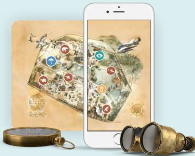
2. Le jeu des mystères (A partir de 20 personnes)