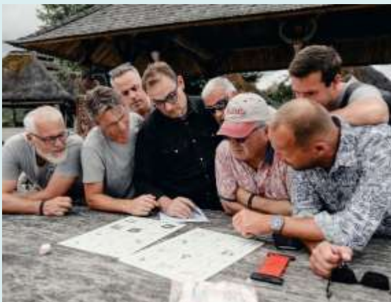
1. Le quiz découverte (A partir de 20 personnes)