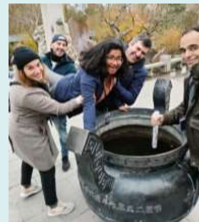
3. Le tour des mondes en défis (de 60 à 100 personnes)